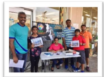
Fund raising at Patel Brothers