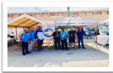
Fund raising at TN Fairground

കേരളത്തിന്റെ വികസന മാതൃകയെ പുനർവിചിന്തനം ചെയ്യാനുള്ള ഒരു അവസരമാണ് പ്രളയം നമുക്ക് നല്കുന്നത്. പരിസ്ഥിതി സംരക്ഷണത്തിനും, സുസ്ഥിര വികസനത്തിനും, പുനരുപയോഗ ഊർജ്ജ സ്രോതസ്സുകൾക്കും നാം മുൻഗണന നല്കണം. ഗാഡ്ഗിൽ അടക്കമു വിവിധ കമ്മിറ്റികളുടെ പഠന റിപ്പോർട്ടുകൾക്ക് സഗൗരവം ശ്രദ്ധയും പരിഗണനയും നല്കണം. ഹ്രസ്വകാല വികസന സങ്കല്പങ്ങളിൽ നീന്നും ദീർഘകാല വീക്ഷണത്തിലേക്ക് എല്ലാവരും ശ്രദ്ധ ചെലുത്തണം. കേരള സർക്കാർ അത്തരം ചർച്ചകളിലേക്ക് നീങ്ങുമെന്ന് പ്രത്യാശിക്കാം.