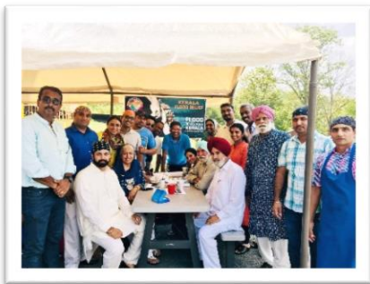
Southern Sikh Religious Society