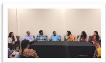
Tennessee Telegu Samithi

അമേരിക്കയിലെ ഏറ്റവും കൂടുതൽ ധനസമാഹരണം നടത്തിയ മലയാളി അസോസിയേഷനുകളിൽ കാൻ മൂനിൽ നിൽക്കുന്നു. അസോസിയേഷന്റെ നേതൃത്വത്തിൽ 86000 ഡോളർ സമാഹരിച്ച് മറ്റ് എല്ലാ സംഘടനകൾക്കും മാതൃകയായി. സമാഹരിച്ച മുഴുവൻ തുകയും നവമ്പർ ആദ്യവാരം മുകുന്ദത്തിയുടെ ദുരിതാശ്വാസ നിധിയിലേക്ക് കൈമാറും. ഈ സംരംഭത്തിൽ സഹകരിച്ച എല്ലാവർക്കും കേരള അസോസിയേഷൻ വേണ്ടി നിസ്സീമമായ കൃതജ്ഞത രേഖപ്പെടുത്തുകയും ഭാവിയിൽ ഇത്തരം ദുരിതങ്ങൾ ഒരിടത്തും ഉണ്ടാകരുതെന്ന് ആശിക്കുകയും പ്രാർത്ഥിക്കുകയും ചെയ്യുന്നു.