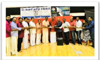
Tennessee Tamil Sangam