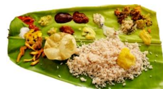
Traditional Onam Sadya

This eclectic assortment of bitter, salty, sour, spicy, and sweet creates a wonderful mix of tastes for even the pickiest of taste pallets. The range of colors against a green backdrop of the natural banana leaf makes the entire meal biodegradable. Remember no utensils here; sadya is best enjoyed with your fingers! It can get a little messy but don’t worry, finger lickin’ isn’t frowned upon – it’s encouraged!